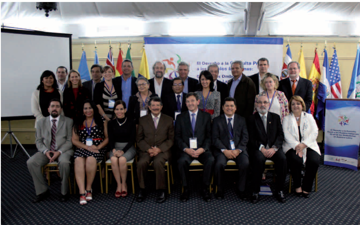
Retrato final de los participantes de la FIO con el equipo de apoyo de la GIZ

Por otro lado, está el derecho a la participación ciudadana. Es un proceso muy reciente, del 2002 hacia adelante, con algunas mejoras pero tenemos el reto de mejorarla y procurar que influya y genere espacios propicios para los momentos de la consulta previa.