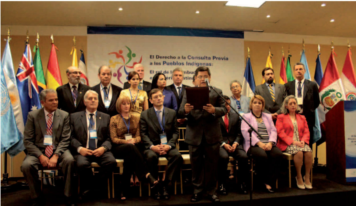
Lectura de la Declaración de Lima