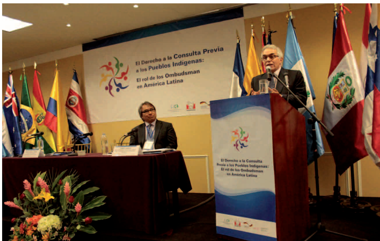
Conferencia magistral sobre derecho internacional: James Anaya, Diego García-Sayán

Hemos avanzado a un punto en que no se discute si hay o no sentencias vinculantes. Pero la armonización de instituciones sociales, políticas y administrativas se ve rebasada por expectativas y demandas contradictorias. La situación es positiva porque los derechos y voluntades democráticas están establecidos. Hay conflictividad en este terreno, pero no cabe duda que las Defensorías pueden afinar mecanismos institucionales para lidiar con ello.